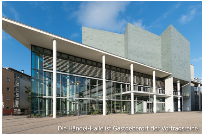
Die Händel-Halle ist Gastgeberort der Vortragsreihe.

*Vorteilpreise für Abonnenten der Mitteldeutschen Zeitung oder Volksstimme