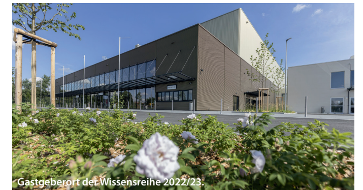
Gastgeberort der Wissensreihe 2022/23.