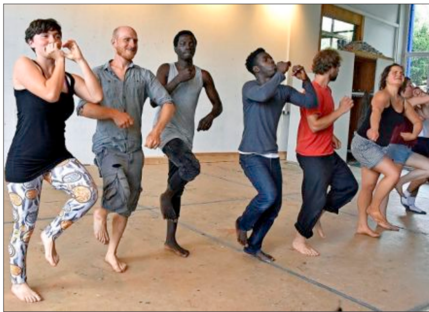
Lange haben sie geprobt, jetzt freuen sich die Teilnehmerinnen und Teilnehmer am Projekt Kontaktunkte auf die Premiere.

Aufführung: am heutigen Freitag, 21. Juni, 18 Uhr, bei „Kubus“, Haslacher Straße 43. Der Eintritt ist frei.