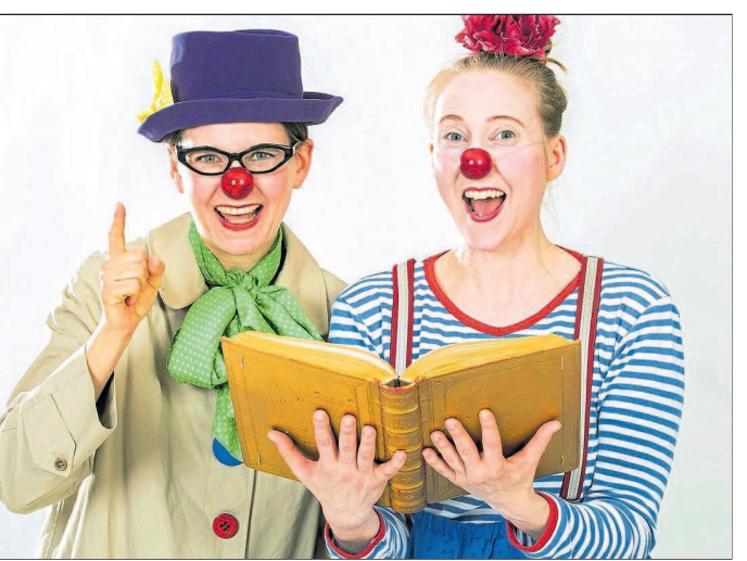
Um die Faszination von Büchern geht es in dem Stück „Der Bücherschatz“.