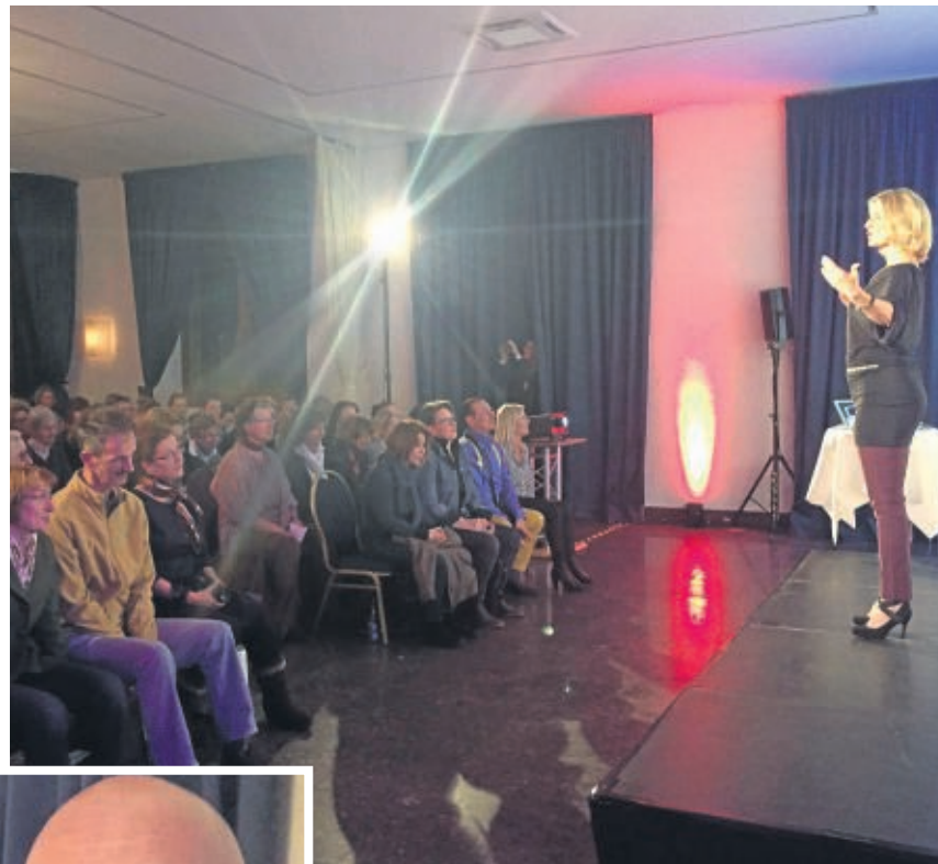
Sich aufrichten: Auch damit verändert man den Klang der Stimme.