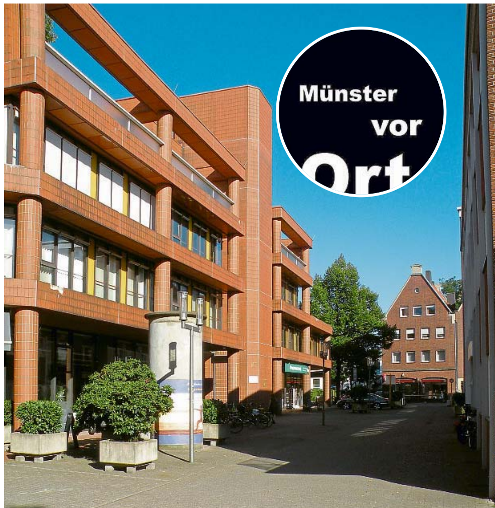
Wiederaufbau trifft auf Nachkriegsmoderne: Giebelhäuser und Aegidiemarkt an der Aegidiistraße.

Ebenso vermag das Hinterland zwischen Schützenstraße und Grüner Gasse zu überraschen: So lagen die ärmlichen Rauschenburgschen Gademern unmittelbar neben dem Wohnhaus der Fürstin Amalia von Gallitzin, dem Mittelpunkt der „Familia sacra“. Heute befindet sich dort das Annette-von-