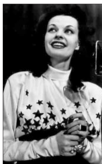
Schauspielerin und Sängerin: Margot Hielscher 1947.

Unmittelbar nach dem Ende des Zweiten Weltkriegs hatte Hielscher im besetzten Deutschland bereits eine zweite Karriere als Sängerin begonnen – als die Amerikaner sie für eine Show engagierten. Mit „Margot's Revue“ und dem „Close Harmony Quartett“ tourte sie insgesamt vier Jahre lang durch die spätere Bundesrepublik.